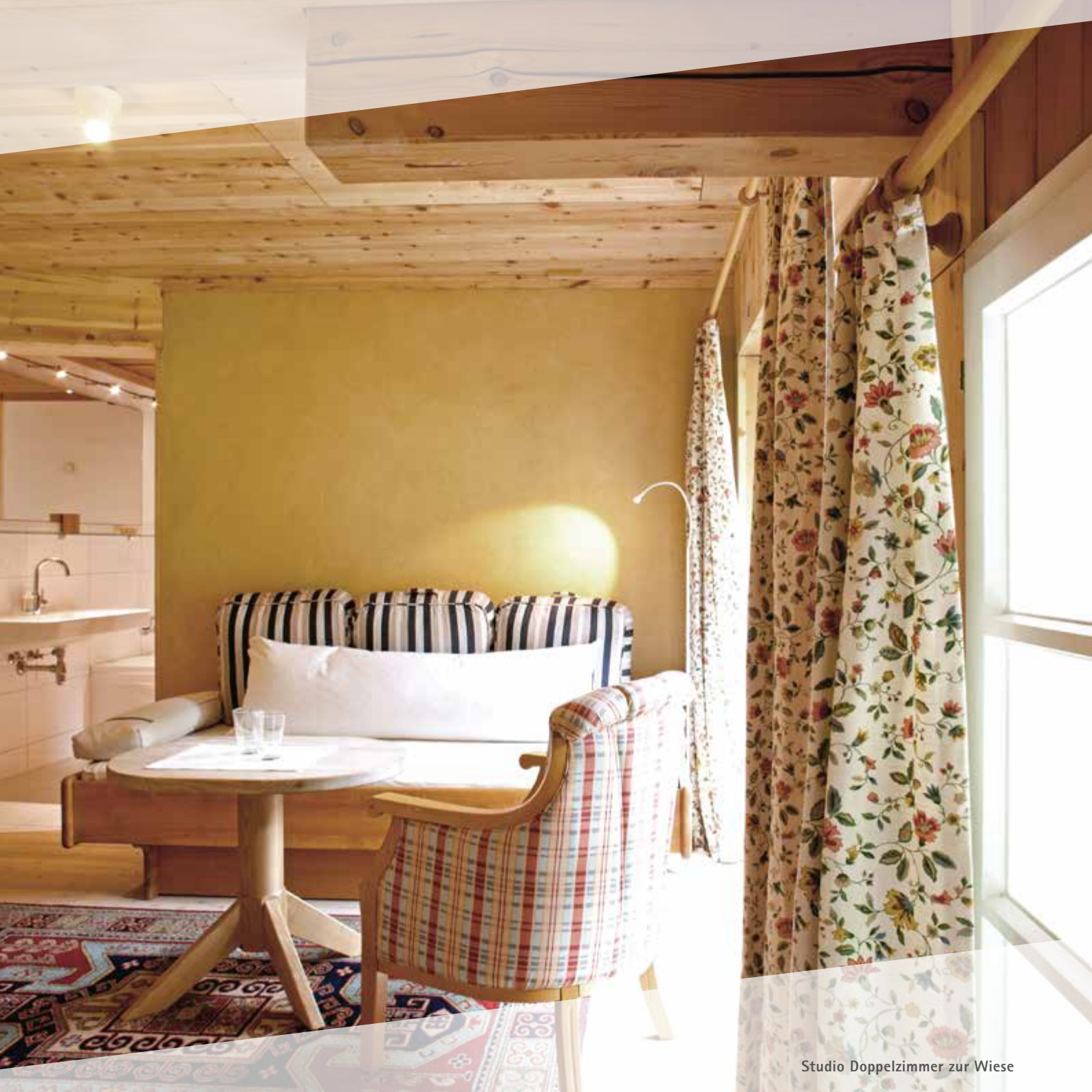
Studio Doppelzimmer zur Wiese