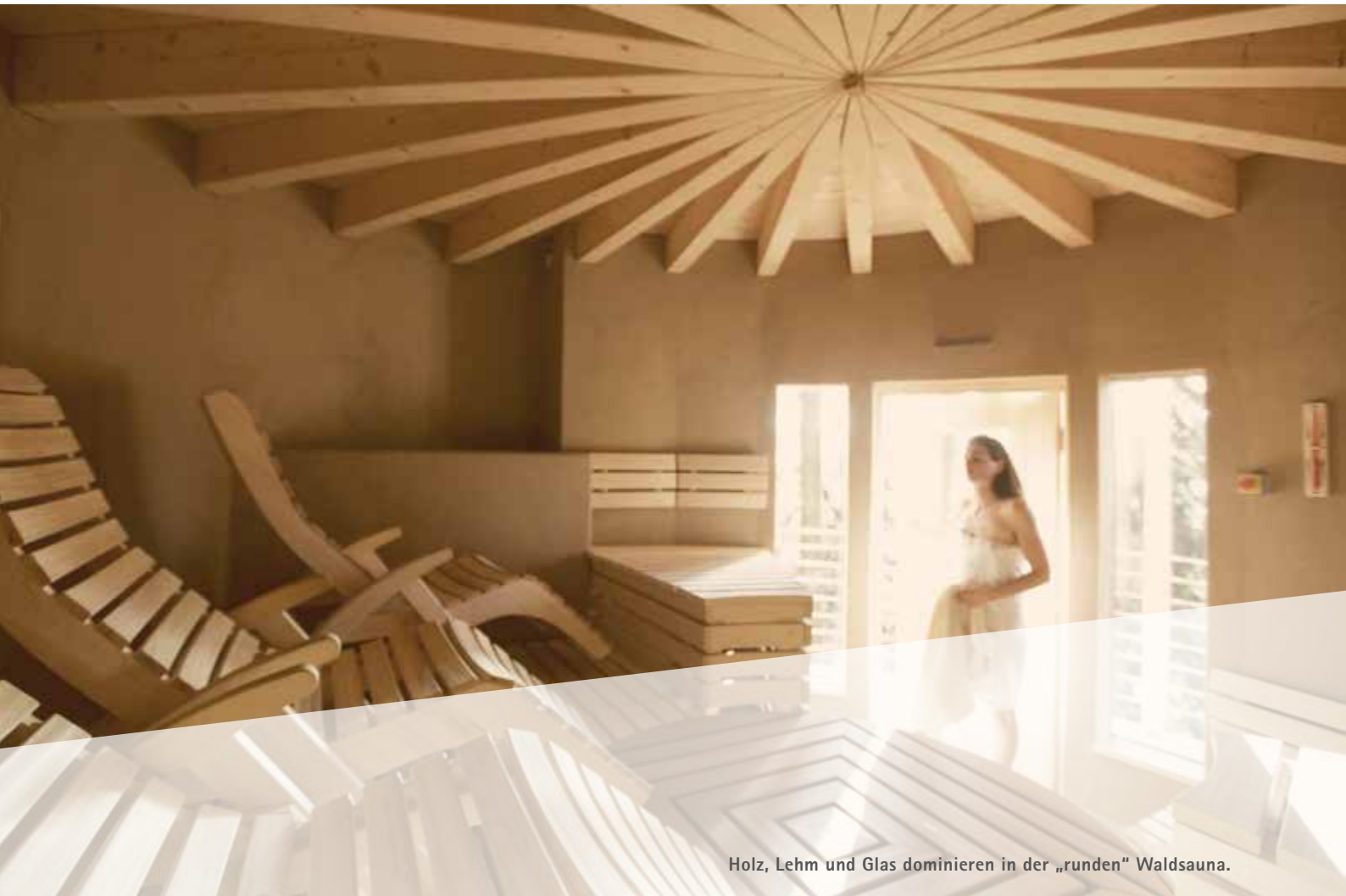
Holz, Lehm und Glas dominieren in der „runden“ Waldsauna.

Doch die „Jurtensauna“ im Wald stiehlt all dem (fast) die Schau! Auf zwei Etagen, kreisrund aus Holz und Lehm mit Panoramafenstern, lädt sie ein, sich einzukuscheln und zu verweilen.